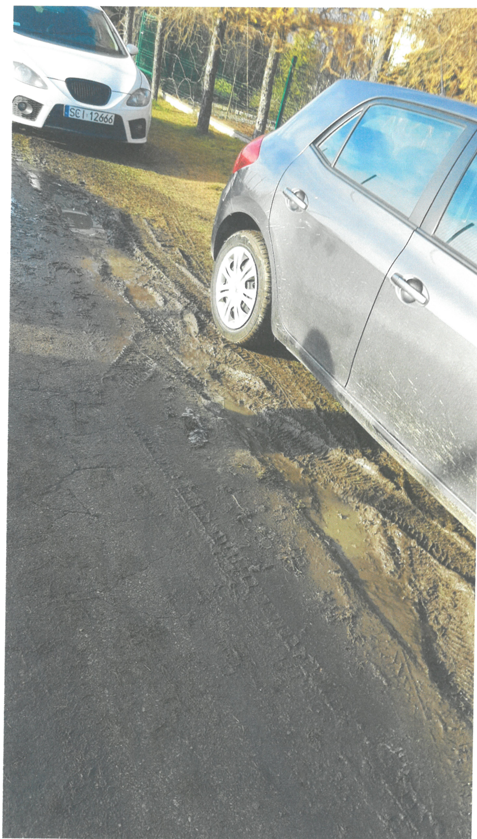
Samo powstały parking wzdłuż pasa zieleni (trawnik) przy Akademii.