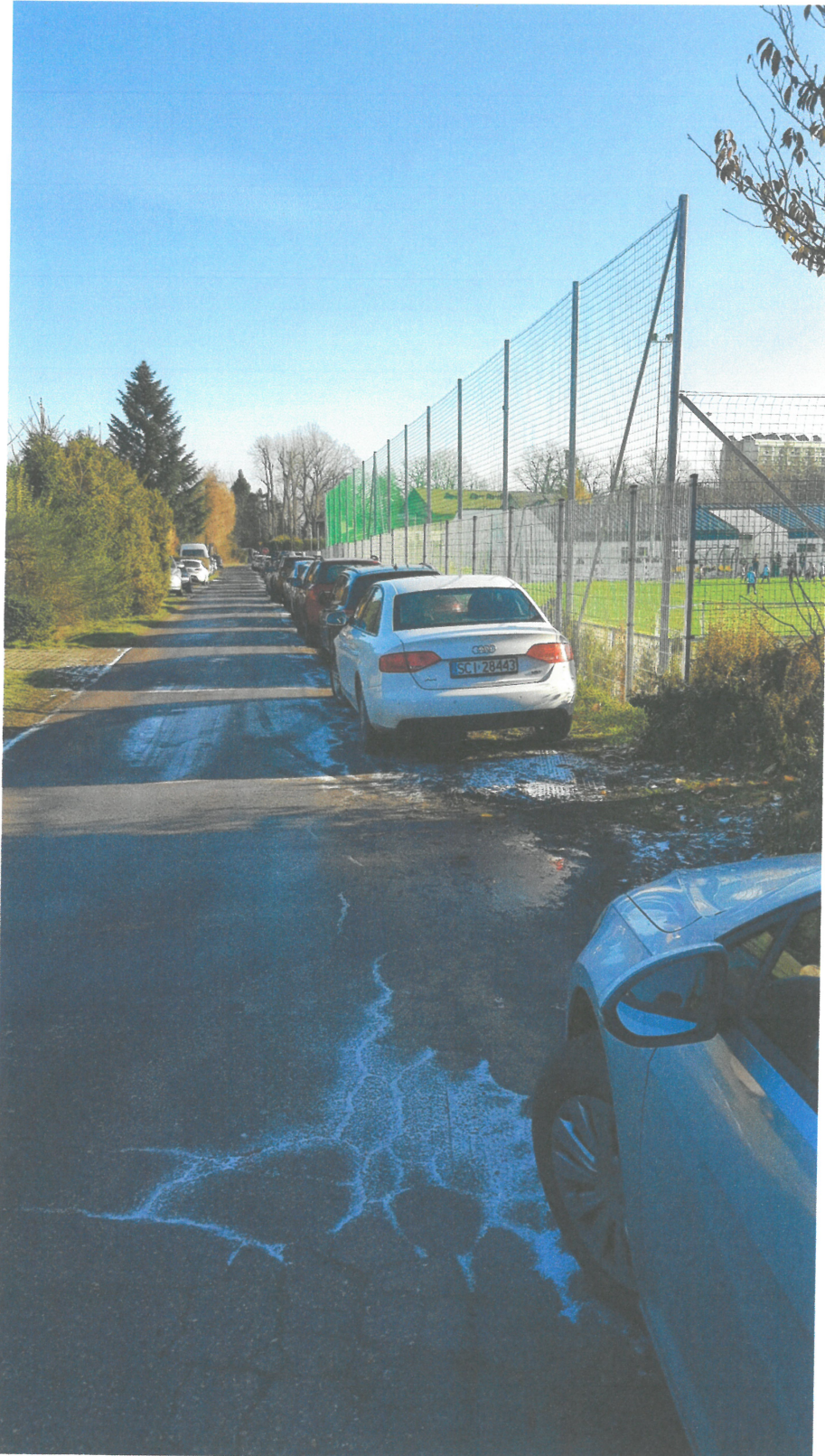
Samo powstały parking wzdłuż pasa zieleni (trawnik) przy Akademii.