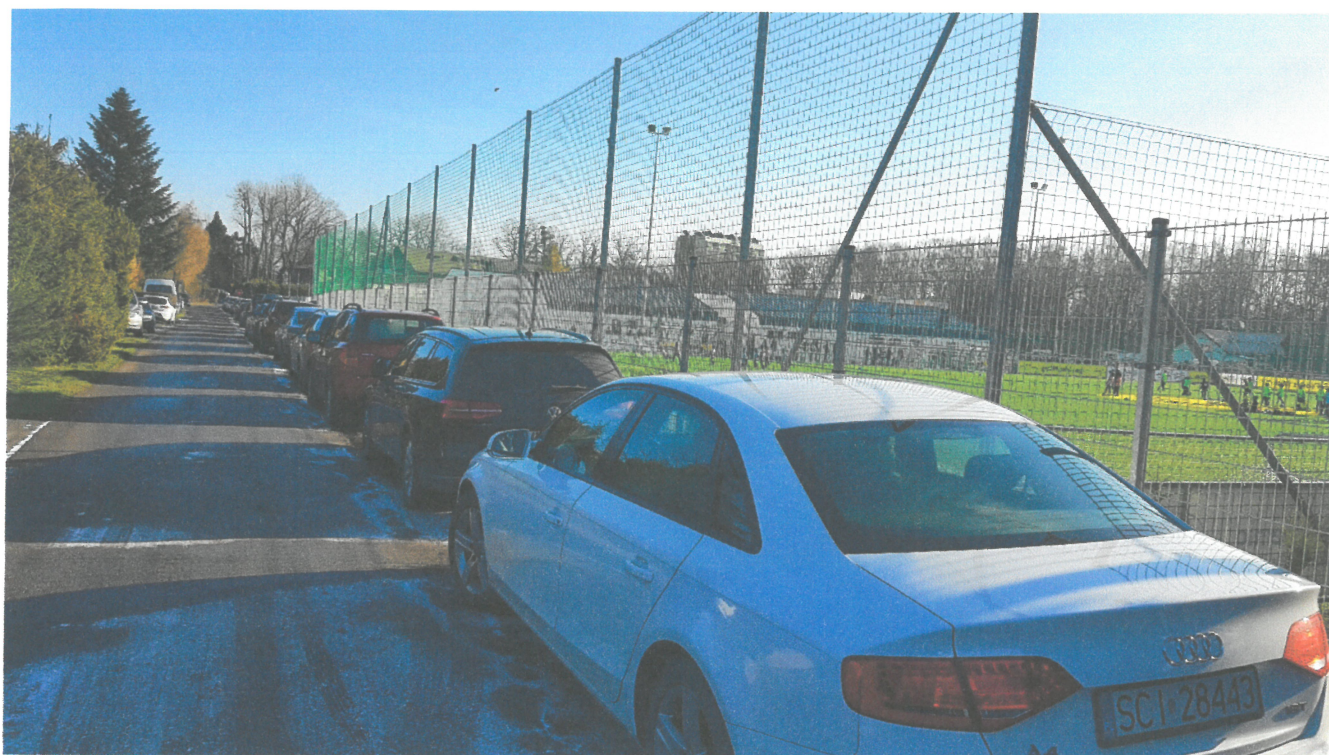
Ciąg samochodów rodziców dzieci rozgrywających mecze. Samo powstały parking wzdłuż pasa zieleni (trawnik) przy Akademii. Zdjęcie nr.1

Rozgrywki szkółki piłkarskiej w Akademii im. Łukasza Piszczka. Niedzielny rano