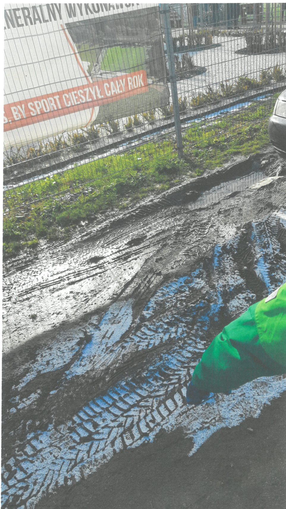
Samo powstały parking wzdłuż pasa zieleni (trawnik) przy Akademii.