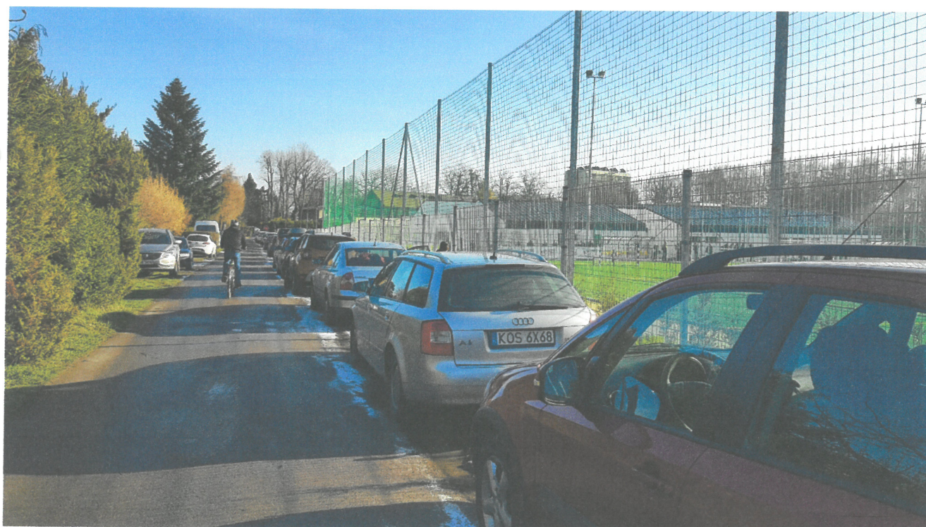
Samo powstały parking wzdłuż pasa zieleni (trawnik) przy Akademii. Zdjęcie nr.2